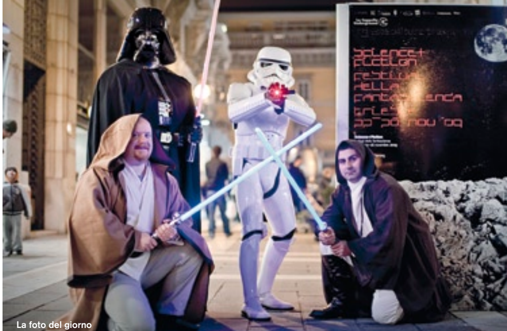
La foto del giorno

Ingresso gratuito per gli accreditati del festival.